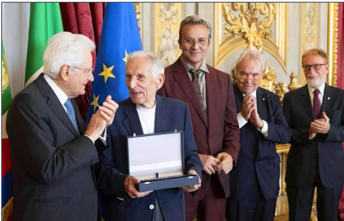
Premio nazionale Presidente della Repubblica, assegnato dall'Accademia Nazionale dei Lincei, 11 ottobre 2023.

Altre onorificenze, premi e riconoscimenti italiani ed esteri: Commendatore dell'Ordine al merito della Repubblica italiana - Grande ufficiale dell'Ordine al merito della Repubblica italiana - Cavaliere di Gran Croce dell'Ordine al Merito della Repubblica Italiana - Medaglia d'oro al merito della Sanità Pubblica - Premio nazionale Presidente della Repubblica dall'Accademia Nazionale dei Lincei - Laurea Honoris Causa Università di Bialystok, Polonia - Laurea Honoris Causa Università di Barcelona, Spagna - Premio America della Fondazione Italia-USA, Camera dei Deputati - Cittadinanza onoraria Consiglio Comunale di Desulo - Premio della Società Italiana di Chimica "Giulio Natta" - Premio Ippocrate per la comunicazione scientifica - Premio "Mens Sana in Corpore Sano", Università degli Studi di Milano - Premio Nuova Spoleto - Premio Angelo dell'Anno - Alkmeon International Prize - Premio Internazionale Sant'Agostino, Città di Bergamo - Premio Il Campione per la Scienza - Premio Luigi Coppola, Lecce - Cavaliere dell'Ordine della Legion d'Onore (Francia). In oltre 50 anni di attività, l'Istituto di Ricerche Farmacologiche Mario Negri, sotto la direzione di Silvio Garattini, ha prodotto oltre 13.000 pubblicazioni scientifiche e circa 250 volumi, in cancerologia, chemioterapia e immunologia dei tumori, in neuropsicofarmacologia, in farmacologia cardiovascolare e renale. Oltre 4000 sono i giovani laureati e tecnici che si sono specializzati in questo periodo presso l'Istituto.