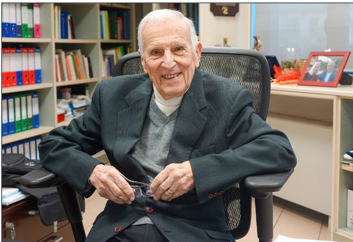
Silvio Garattini, Presidente dell'Istituto di Ricerche Farmacologiche Mario Negri IRCCS.

quanto ruota attorno alla prevenzione. Devono evitare il più possibile di essere vittime della pubblicità e di una informazione condotta da chi vende.