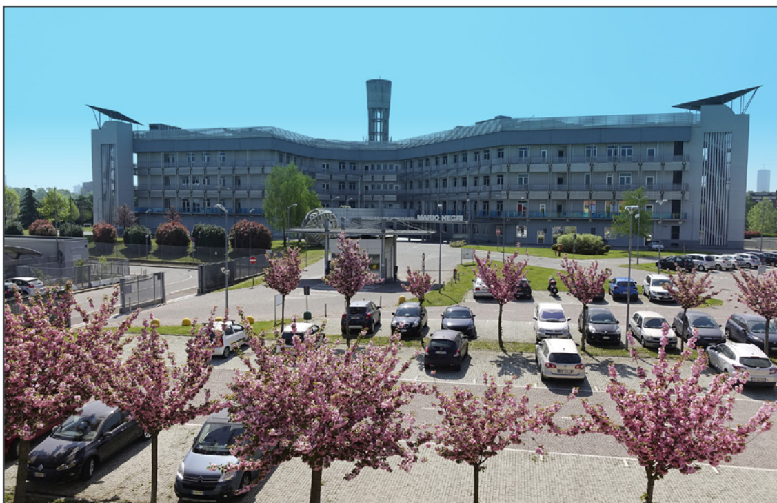
L'Istituto di Ricerche Farmacologiche Mario Negri IRCCS.

e iniziammo la costituzione dell'Istituto intitolato a Mario Neri che venne aperto il 1 febbraio del 1963 con grande contrasto e opposizione da parte della Facoltà di Medicina di Milano.