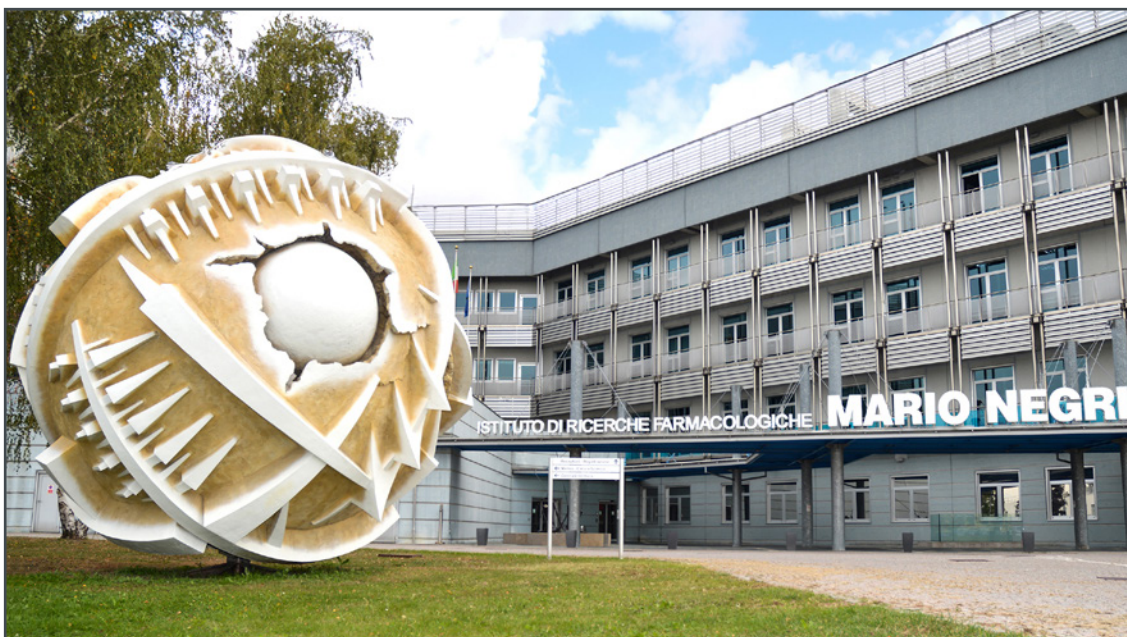
L'ingresso dell'Istituto di Ricerche Farmacologiche Mario Negri IRCCS.